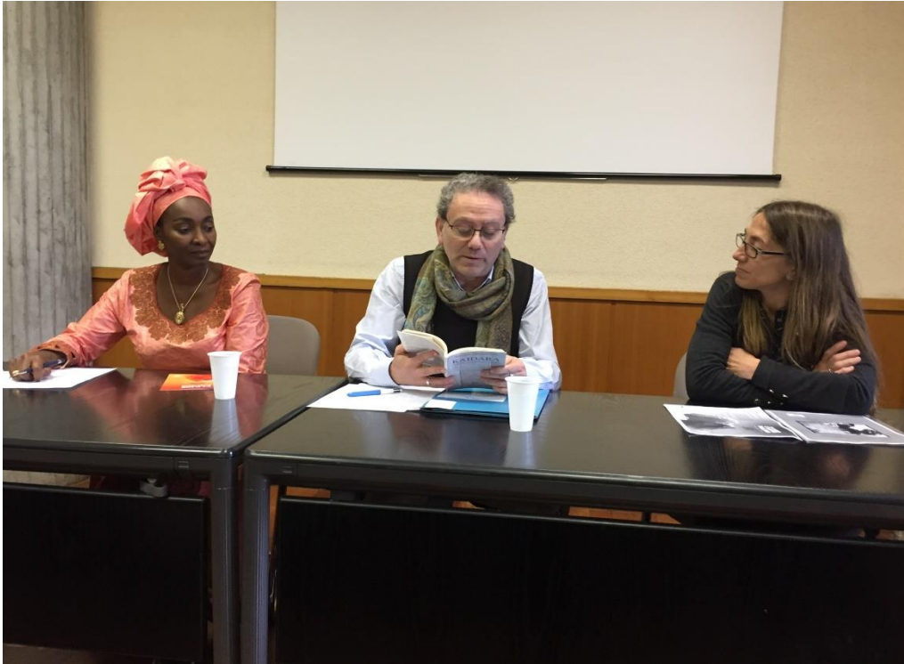
Foto de una de las actividades en la Facultad de Filosofía y Letras: