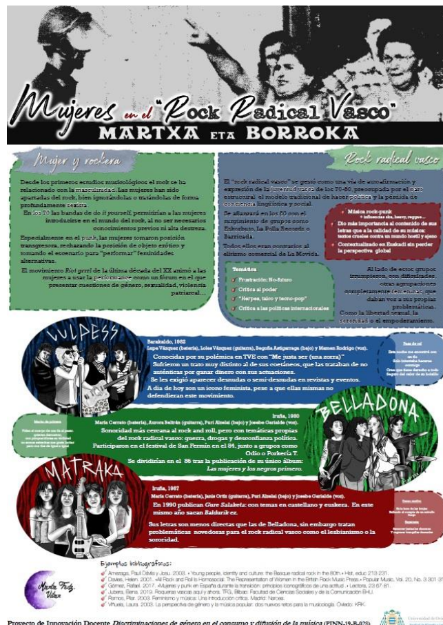
Figura 1. Uno de los pósters en PDF presentados en la sesión de Microsoft Teams

Una cuarta fase se dirige a visibilizar el trabajo realizado en el aula, compartiéndolo con el resto de la Facultad. Debido a las restricciones de la pandemia, este curso se optó por un entorno online para la exposición de los trabajos de clase en formato póster 2 . Los títulos de los pósters elaborados por el alumnado de Género fueron los siguientes: Protagonistas en femenino ; Batallas de Gallos: problemas de género ; Dos compositoras españolas: María de Pablos y Rosa García Ascot ; La evolución en el discurso de Taylor Swift ; Mujeres en el Rock Radical Vasco ; y Mamamoo: el feminismo infiltrado (Figura 1). En cuanto a la asignatura de Danza, de los 4 alumnos que cursaron en evaluación continua la materia, dos trabajos tuvieron relación con el género: Ballroom halls: conjunción de discursos ; y El can-can y la mujer . Estos pósters se compartieron también en el espacio común creado en el Campus Virtual.